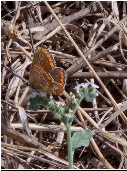
2.- Jardín de las mariposas reales.