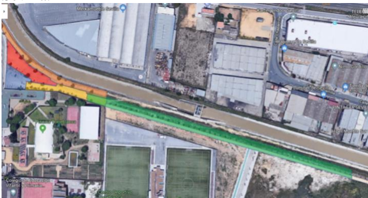
Detalle señalado en verde del Paseo Juan Saura.

Repoblación forestal: Se han sembrado, criado, regado con cariño más de 100 árboles en el borde del Canal de los presos en el Paseo Juan Saura.