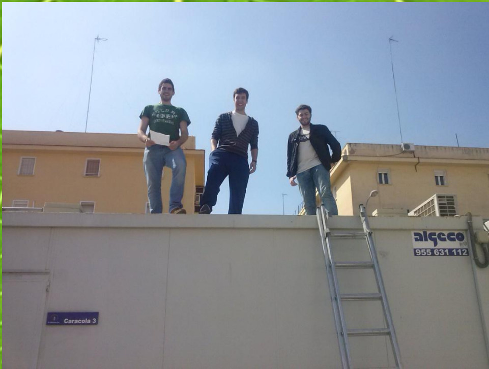
Imagen 5- Medición de techo

Por otro lado habría que hablar sobre el mantenimiento de esta, que sería de bajo coste, ya que se optaría por la retirada de hojas por sopladores, cuyo coste sería barato y se produciría un gran ahorro de tiempo.