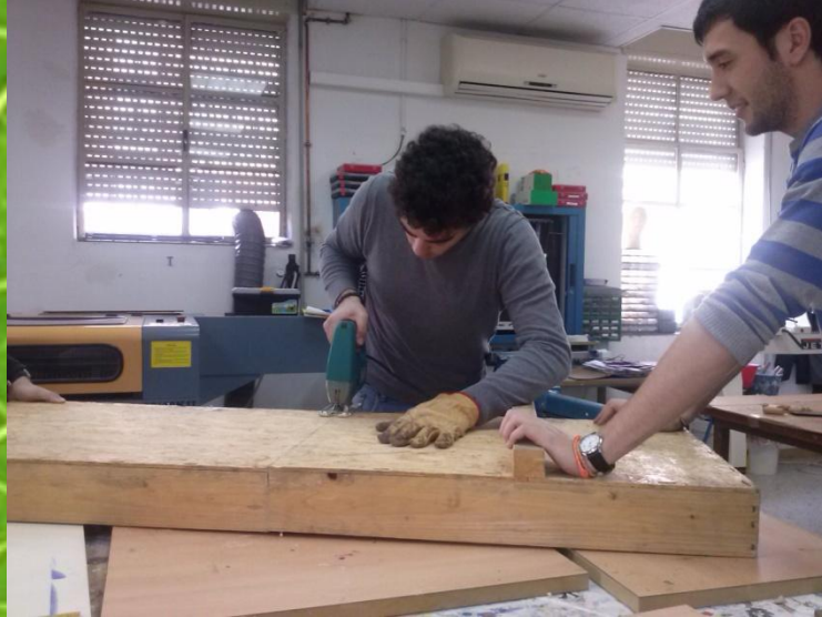
Imagen 1: Realización del soporte con materiales reciclados

maceteros a partir de maderas reutilizadas, lo que hizo que el tiempo instalación aumentara.