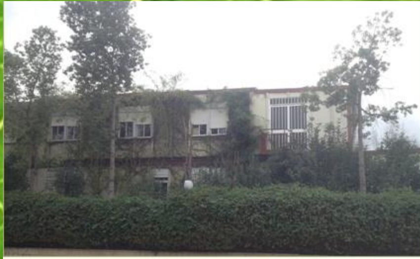
Imagen 4- Pared verde exterior

Por otro lado, también se propone el aislamiento en la parte superior de la caracola, se han desarrollado dos posibles líneas de estudio: