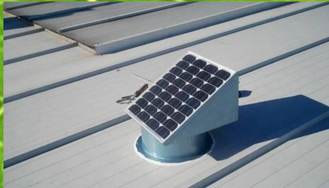
Imagen 6- Extractor fotovoltaico