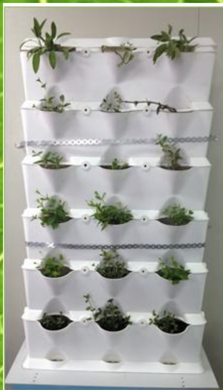
Imagen 3- Pared vegetal

El resultado de la pared natural interior fue el siguiente: