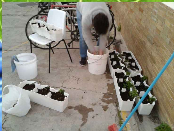
Imagen 2- Plantación

El coste de la instalación fue de cero euros, ya que los maceteros fueron cedidos por el grupo TAR, al igual que las plantas, las maderas, la bomba y las líneas de riego.