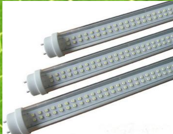
Imagen 7- Tubos LED