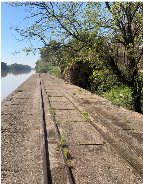
Embarcadero de mineral de Cala, grupo Tar 2025.

Donde en una segunda fase se diseñará la conexión del muelle de cargadores con el embarcadero de mineral de Cala, que esta inmediatamente conectado con el mismo con un tramo existente de vías originales que da continuidad física al proyecto