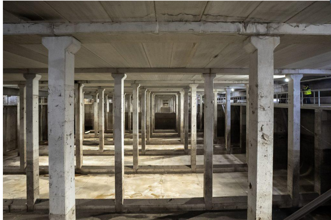
FOTO TANQUE DE TORMENTAS KANSAS CITY

TANQUES DE TORMENTAS EN TRIANA Y SEVILLA ESTE Y UN COLECTOR EN EL CERRO: EL PLAN PARA PROTEGER LA CIUDAD DE INUNDACIONES EL AYUNTAMIENTO RETOMARÁ LOS PROYECTOS PARA CONSTRUIR DOS NUEVOS DEPÓSITOS DE RETENCIÓN DE AGUA EN CARRETERA AMARILLA Y BLAS INFANTE, QUE SE SUMARÁN A LOS QUE YA HAY EN LA ALAMEDA DE HÉRCULES Y KANSAS CITY.