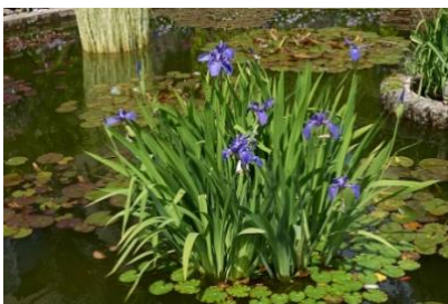
Lirios de agua