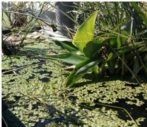
Canal de plantas del grupo Tar, calas, paraguistas o papiros, lemnas.