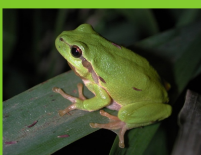
Rana de san antonio

El estanque también dispone de un refugio para anfibios, separado del estanque y alejado de los depredadores. Podemos encontrar ranas de san antonio, ranas meridionales, sepillo moteado ibérico y ranas verdes comunes.