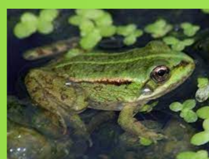
Rana verde común