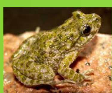
Sepillo moteado ibérico