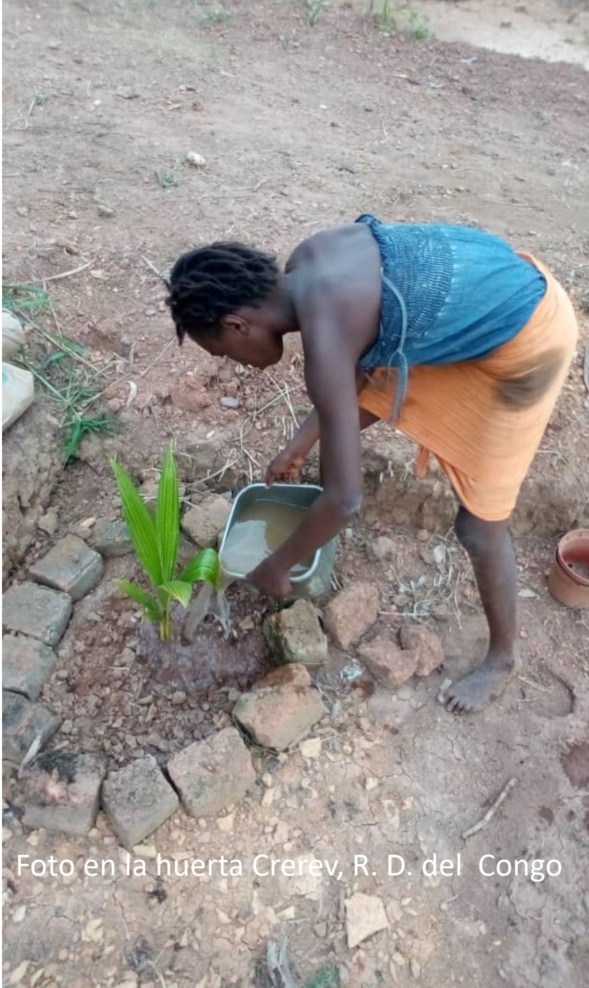
Foto en la huerta Crerev, R. D. del Congo