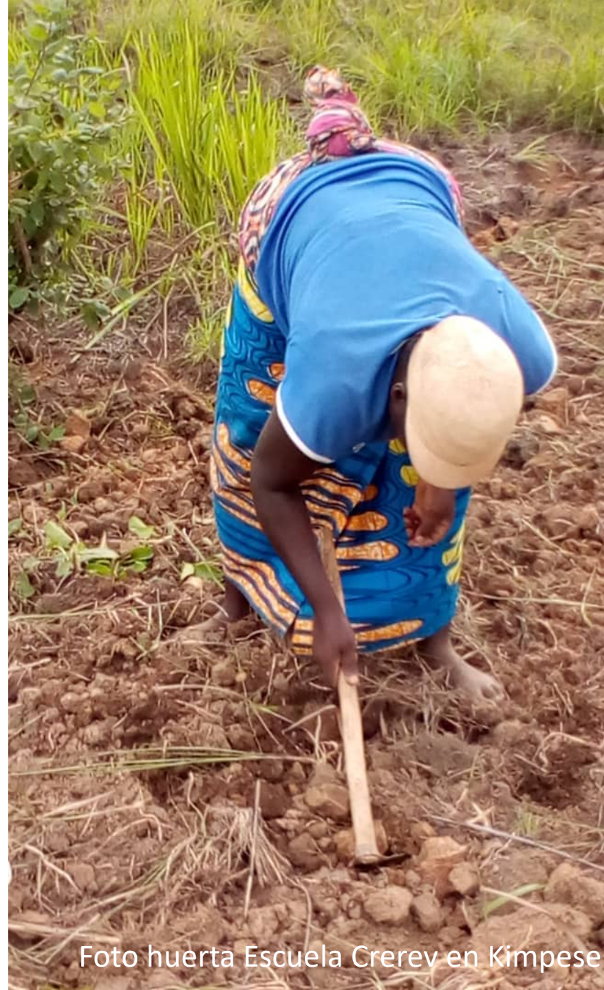
Foto huerta Escuela Crerev en Kimpese

No te olvides de poner humedad, aireación y luz adecuados a cada planta cultivada, aprenderás fácilmente con los mayores de la comunidad y en www.aguapedia.org y grupotar@us.es tienes apoyo e información siempre.