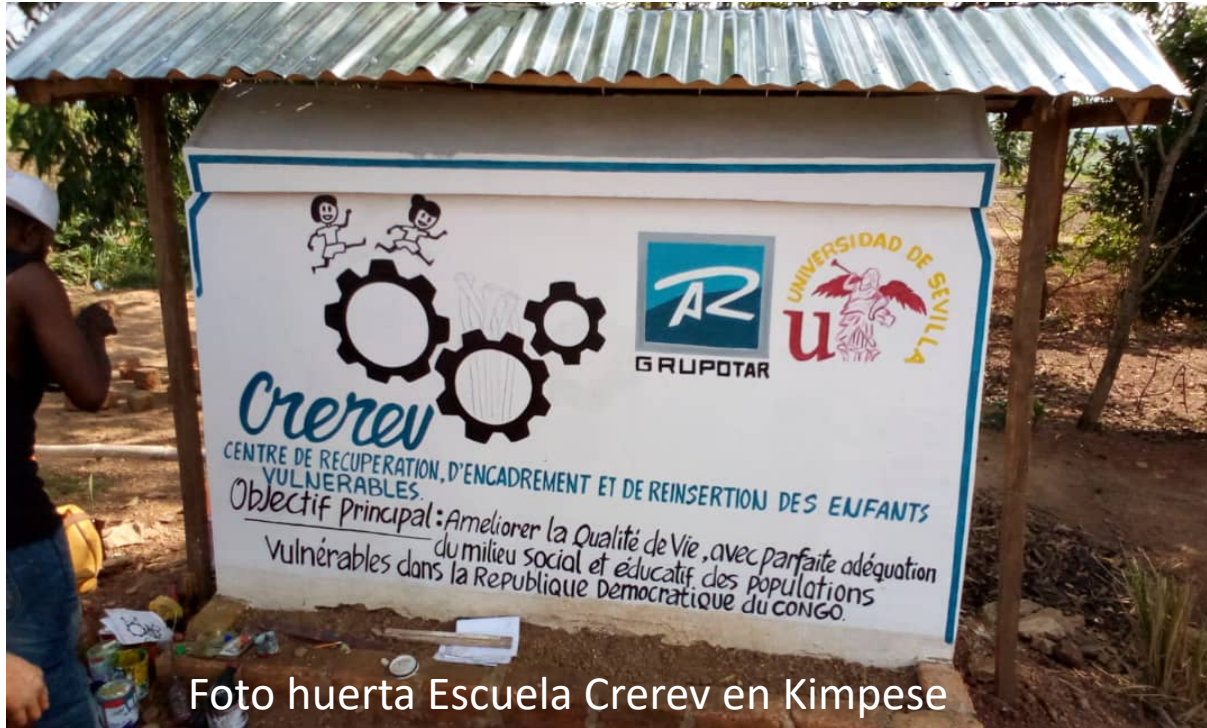
Foto huerta Escuela Crerev en Kimpese

Talleres de Huerta cajón Domestico, (de fruta o verdura), Para el desarrollo de la mujer que lleva su familia adelante y la comunidad en general