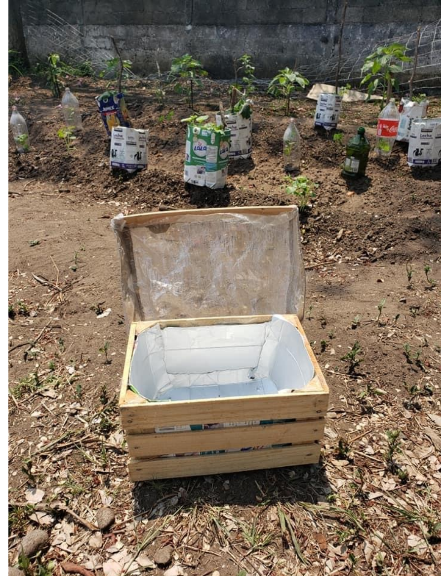
Foto: cajón con cartón de tetrabrick

Poner una bandeja debajo del cajón para recoger lixiviado del cajón. Y reaprovecharlo en los siguientes riegos.